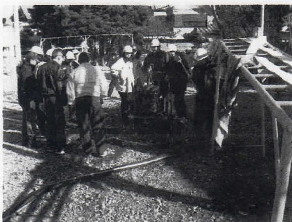
(住民への可搬ポンプ取扱い指導)

私たち消防団は、「自らの地域は、自らが守る」という使命感のもと、地域防災のリーダーとして幅広い活動をしています。