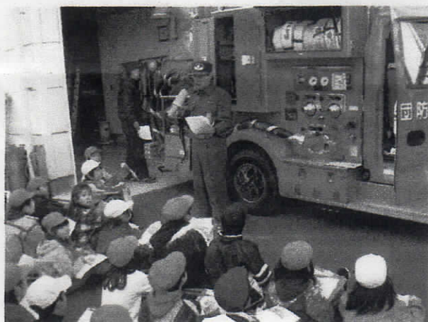
(小学生への防火指導)

消防活動には専門的知識と技術が必要です。消防団は、普段から消火訓練や応急手当訓練を行い、資質の向上に努めています。