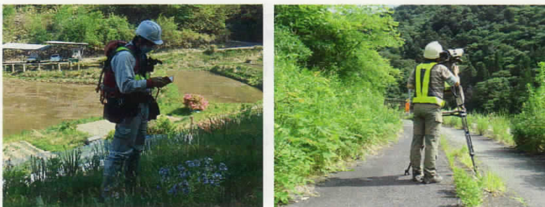
動植物調査の様子

○その他：調査にあたっては、身分証明書を携帯し、また調査員であることを示す腕章を着用いたします。また、駐車車両には、調査用車両と分かるように表示いたします。