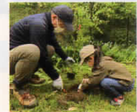
親子で県民参加の森づくり参加植樹活動