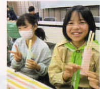
緑の少年団交流集会 my 著づくり