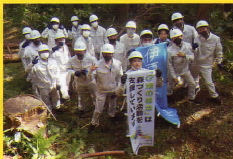
静岡県立伊豆総合学校 学校林での森林整備を支援