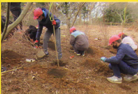
みどりのふれあい事業(三島市)植樹活動を支援