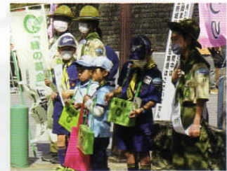
ボーイスカウトによる緑の募金活動