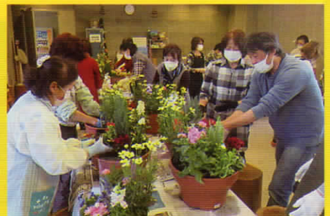
寄せ植え教室(富士宮市)の開催を支援